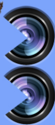
foto maratón domingo 23 octubre 9:00 Parque Público Municipal puerto lumbreras 2011

sólo cámaras digitales 2 categorías: Absoluta e Infantil Inscripciones: 5€ Espacio Joven silybum@silybum.es día de la prueba, hasta 9:30 Más info y bases en www.silybum.es